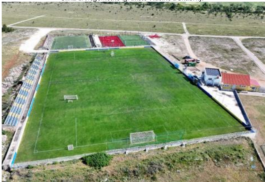
Slika 1. Nogometno igralište Vlačine u Škabrnji